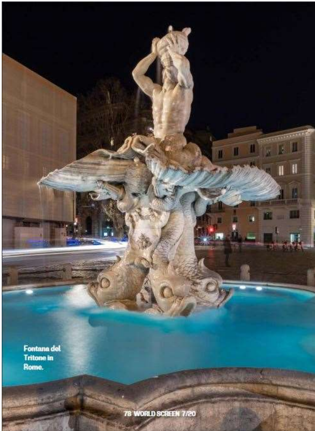
Fontana del Tritone in Rome.